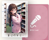
アイドルカード 30枚